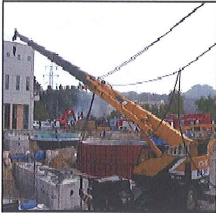
[크레인에 의한 전력선 단선 고장]