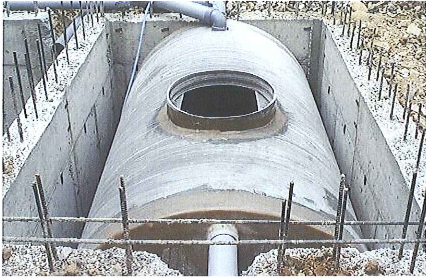
정화조 콘크리트 보호벽 조치